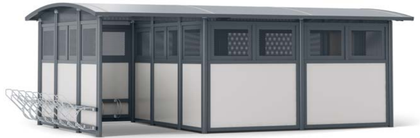
Cykelskuret Tellus kan udformes på flere forskellige måder, også med hjulholdere og rammelås på ydervæggen.