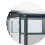
Hærdet glas i væggen