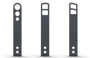
Cykelstander Orion, Calypso og Delta