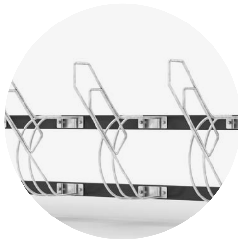
Rammelås Rambo monteret på cykelstativet Bike