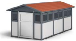
Alpha, højde 2.877 mm